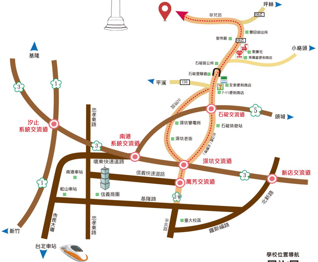
■ 華梵大學交通路線圖